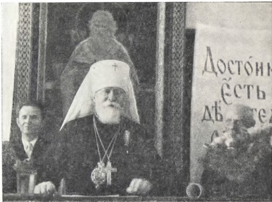
МИТРОПОЛИТ НИКОЛАЙ ПРОИЗНОСИТ РЕЧЬ В ЗАЛЕ ДУХОВНОЙ АКАДЕМИИ ПОСЛЕ ПРОВОЗГЛАШЕНИЯ ЕГО ДОКТОРОМ БОГОСЛОВСКИХ НАУК